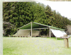
バーベキューサイト