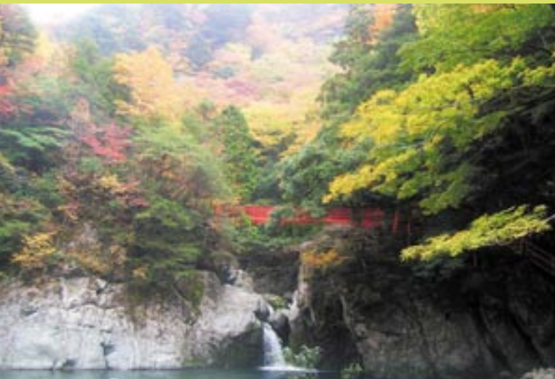
裏匹見峽紅葉(平田淵)